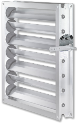
FESTSTELLVORRICHTUNG AN JZ-AL