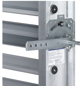
FESTSTELLVORRICHTUNG AN JZ-AL, JZ-HL-AL

Die Feststellvorrichtung befindet sich auf der ersten Lamelle von oben (Klappen bis drei Lamellen) oder auf der dritten Lamelle von oben (Klappen ab vier Lamellen)