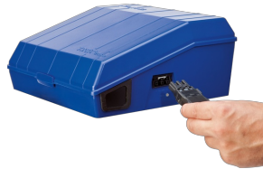
ANSCHLUSSBUCHSE FÜR BELEUCHTUNG