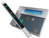
Beleuchtungsschaltung über Bedieneinheit