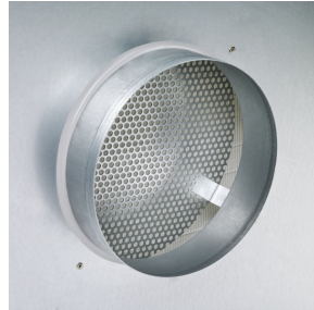
Stutzen mit feststehendem Prallblech