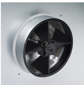
Stutzen mit Drosselement