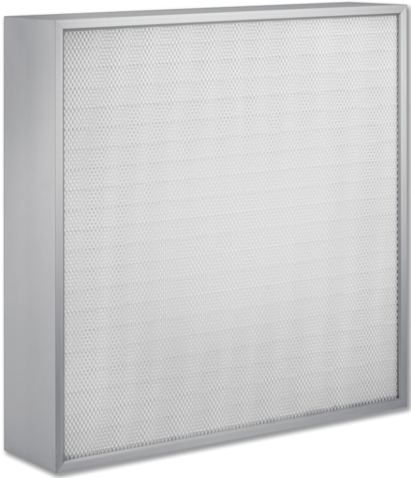
FHD – Ausführung ohne Mittelsteg