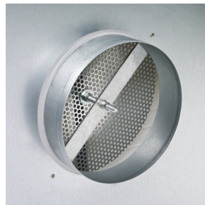
Stutzen mit verstellbarem Prallblech