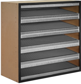
AKTIVKOHLE- FILTERZELLE, SERIE ACF