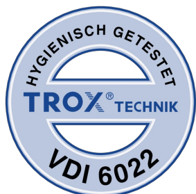
TESTÉS CONFORME À LA NORME VDI 6022