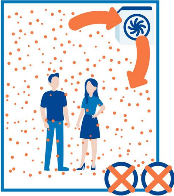
„Room air conditioner“ without filtration

Air conditioning systems without fresh air, without filters, or with only inadequate filters, do not reduce the virus load in a room.