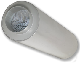
ROHRSCHALLDÄMPFER SERIE CAK