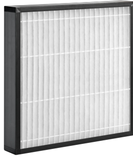
Z-Line-Filter, Ausführung PLA