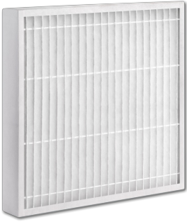
Z-Line Filter, Ausführung NWO